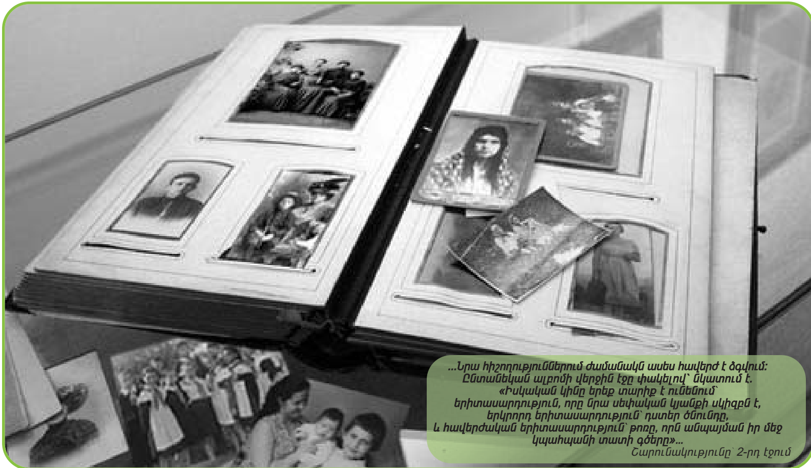
...Նրա հիշողություններում ժամանակն ասես հավերժ է ձգվում: Ընտանեկան ալբոմի վերջին էջը փակելով՝ նկատում է. «Իսկական կինը երեք տարիք է ունենում՝ երիտասարդություն, որը նրա սեփական կյանքի սկիզբն է, երկրորդ երիտասարդություն՝ դատեր ծնունդը, և հավերժական երիտասարդություն՝ թողոք, որն անպայման իր մեջ կպահպանի տատի գծերը»... Շարունակությունը 2-րդ էջում