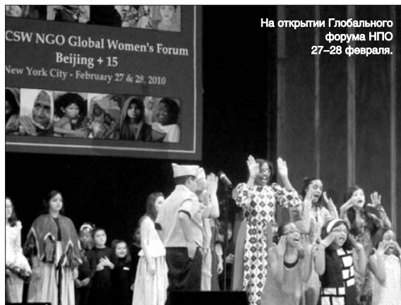
На открытии Глобального форума НПО 27–28 февраля.