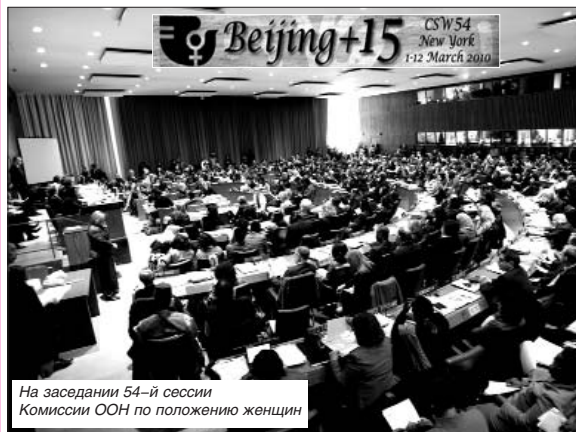
На заседании 54-й сессии Комиссии ООН по положению женщин

БЕСПЛАТНОЕ ПРИЛОЖЕНИЕ К ГАЗЕТЕ «НОВОЕ ВРЕМЯ» МАРТ-АПРЕЛЬ 2010